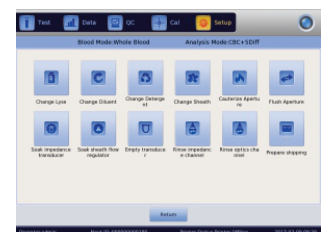
Sistema de manutenção